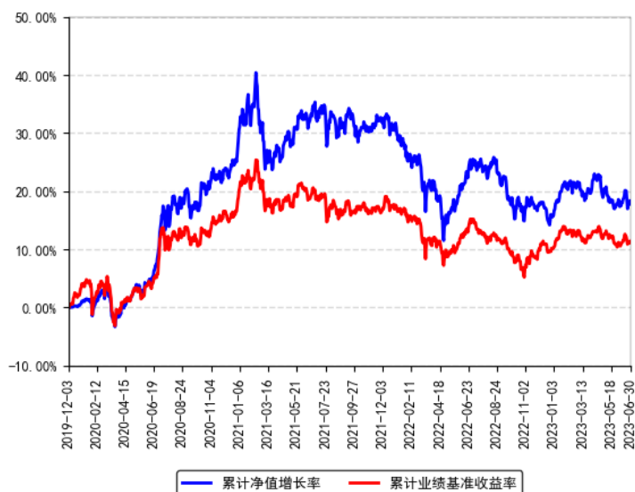
南方养老目标日期2030三年持有混合发起（FOF）A累计净值增长率与同期业绩比较基准收益率的历史走势对比图