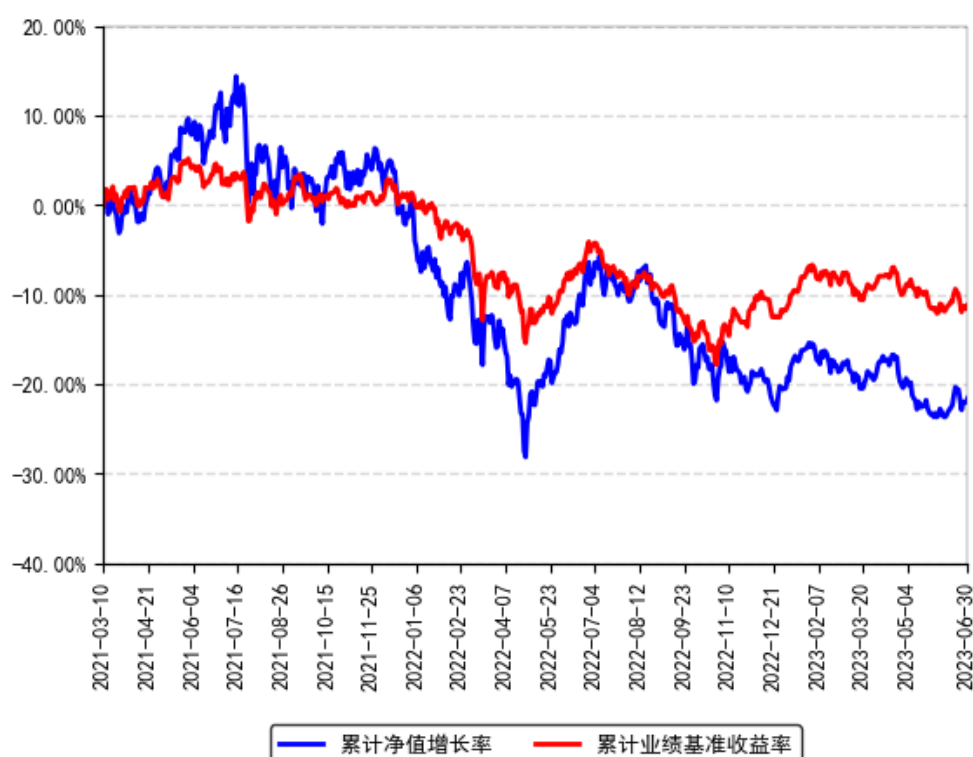
南方优质企业混合A累计净值增长率与同期业绩比较基准收益率的历史走势对比图