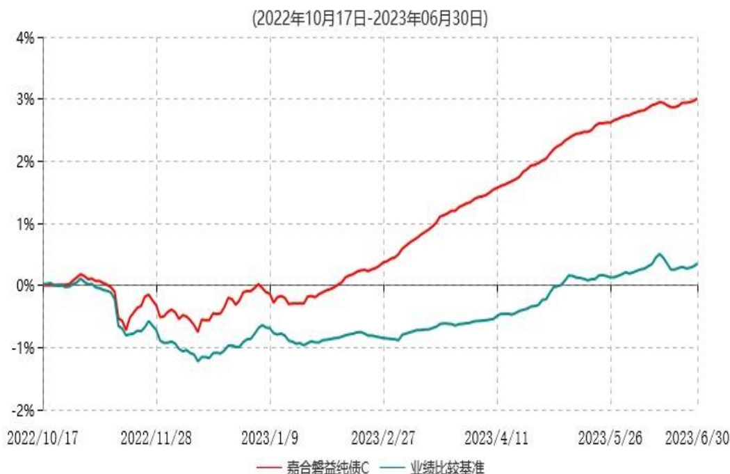
嘉合磐益纯债C累计净值增长率与业绩比较基准收益率历史走势对比图