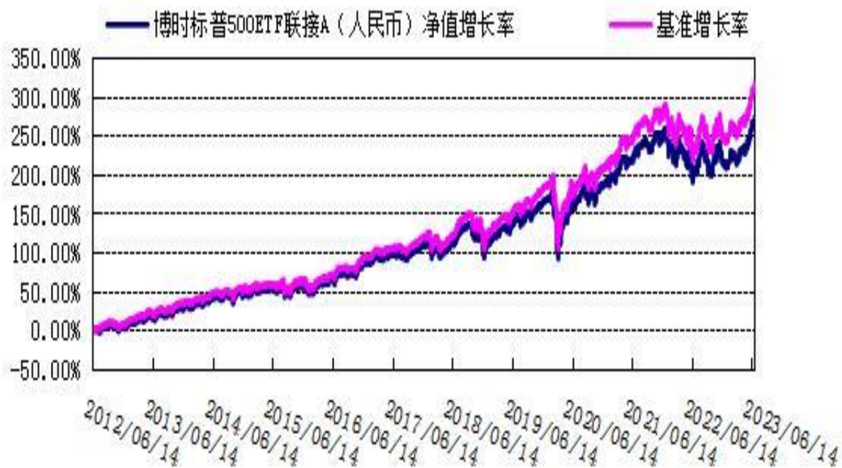
博时标普 500ETF 联接 C