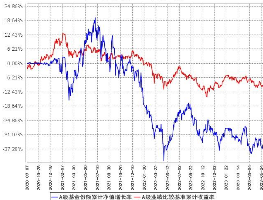
A级基金份额累计净值增长率与同期业绩比较基准收益率的历史走势对比图 (2020年9月7日至2023年6月30日)