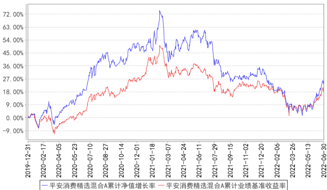
平安消费精选混合A累计净值增长率与同期业绩比较基准收益率的历史走势对比图