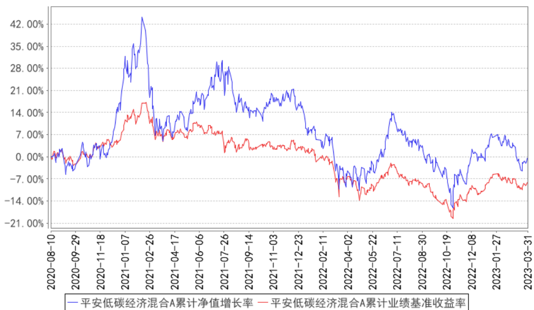
平安低碳经济混合A累计净值增长率与同期业绩比较基准收益率的历史走势对比图