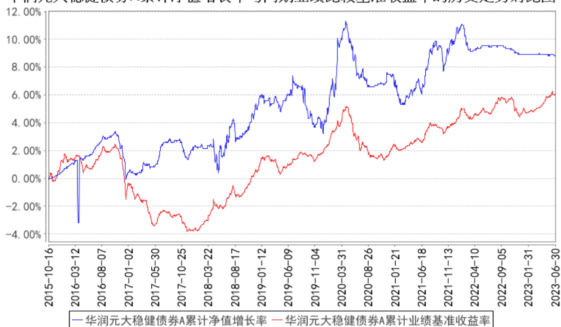
华润元大稳健债券A累计净值增长率与同期业绩比较基准收益率的历史走势对比图

（二）自基金合同生效以来基金累计净值收益率变动及其与同期业绩比较基准收益率变动的比较（2015年10月16日至2023年6月30日）