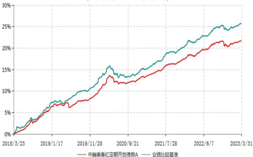
中融季季红定期开放债券A累计净值增长率与业绩比较基准收益率历史走势对比图 (2018年03月23日-2023年03月31日)