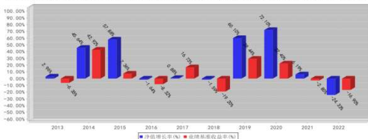
兴全商业模式混合（LOF）基金每年净值增长率与同期业绩比较基准收益率的对比图（2022年12月31日）