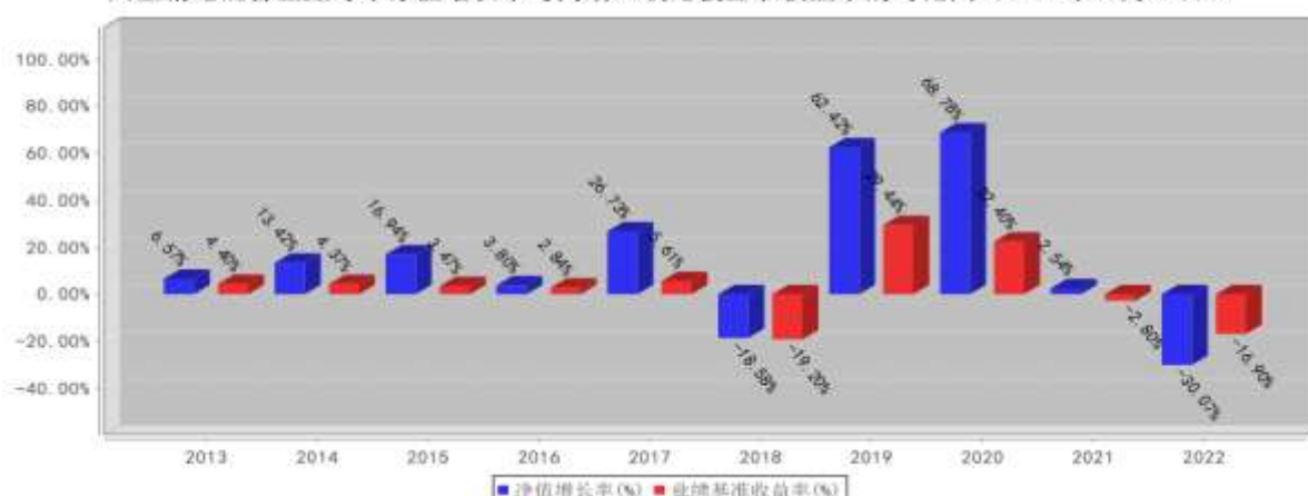
兴全精选混合基金每年净值增长率与同期业绩比较基准收益率的对比图（2022年12月31日）

注：1、由于兴全保本在第二个保本周期届满后不再符合保本基金存续条件，根据《兴全保本混合型证券投资基金基金合同》的约定，自2017年9月6日起兴全保本转型为非保本的混合型基金，名称相应变更为“兴全精选混合型证券投资基金”，业绩比较基准自该日起变更为80%×沪深300指数收益率+20%×中证国债指数收益率。