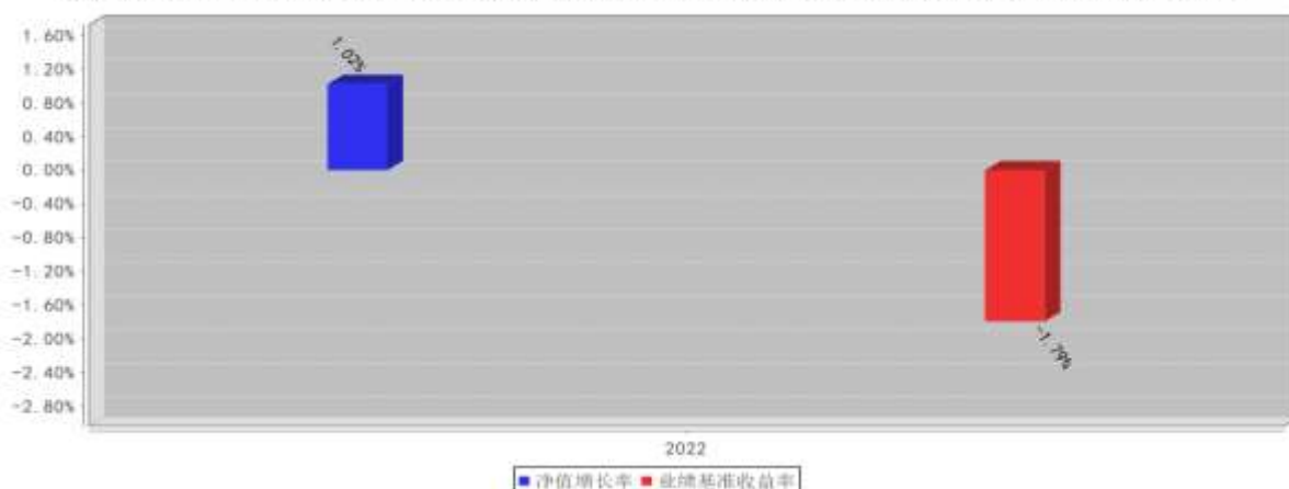
兴证全球合瑞混合C基金每年净值增长率与同期业绩比较基准收益率的对比图（2022年12月31日）

注：1、2022年数据统计期间为2022年9月7日（基金合同生效之日）至2022年12月31日，数据按实际存续期计算，不按整个自然年度进行折算。