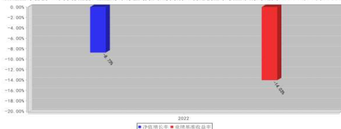
兴证全球合衡三年持有混合A基金每年净值增长率与同期业绩比较基准收益率的对比图（2022年12月31日）

注：1、2022年数据统计期间为2022年1月13日（基金合同生效之日）至2022年12月31日，数据按实际存续期计算，不按整个自然年度进行折算。