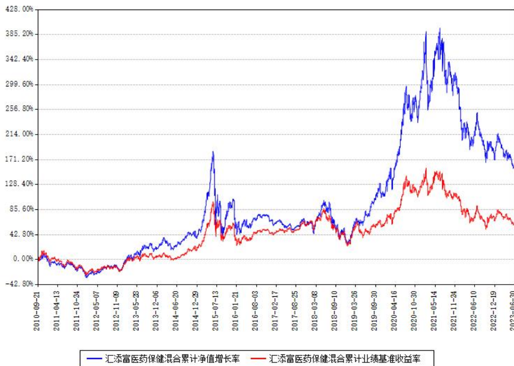
汇添富医药保健混合累计净值增长率与同期业绩基准收益率对比图