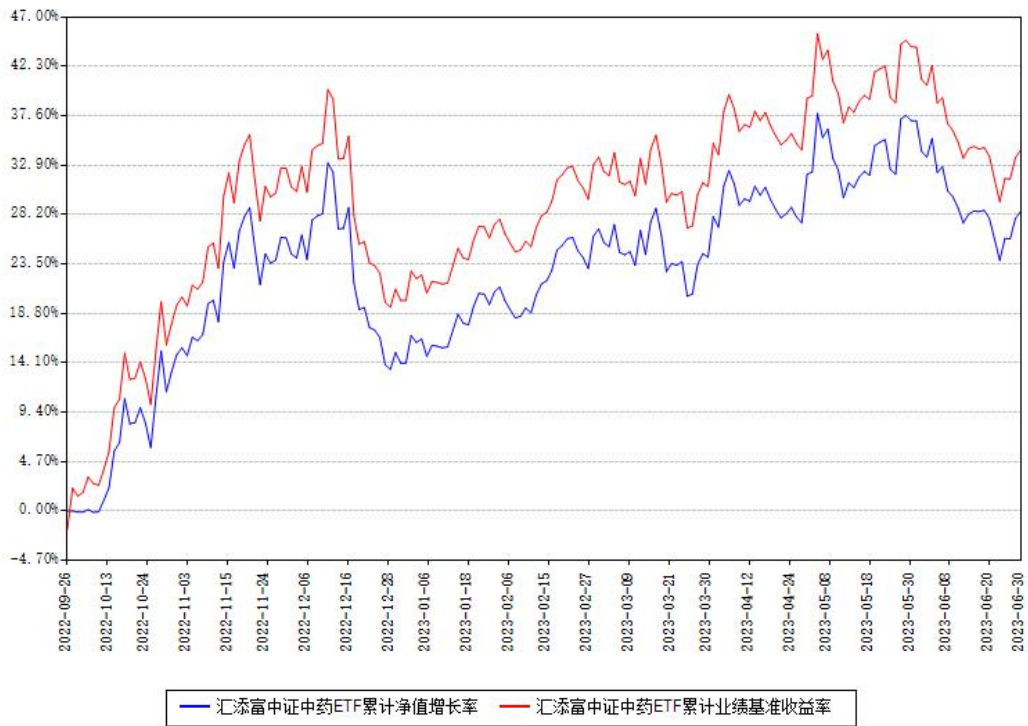
汇添富中证中药ETF累计净值增长率与同期业绩基准收益率对比图