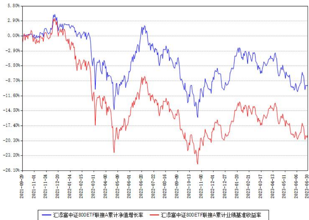
汇添富中证800ETF联接A累计净值增长率与同期业绩基准收益率对比图

(二) 自基金合同生效以来基金累计净值增长率变动及其与同期业绩比较基准收益率变动的比较图