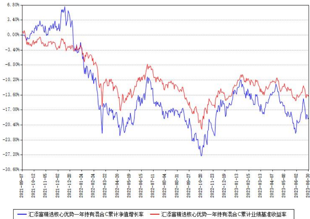
汇添富精选核心优势一年持有混合C累计净值增长率与同期业绩基准收益率对比图