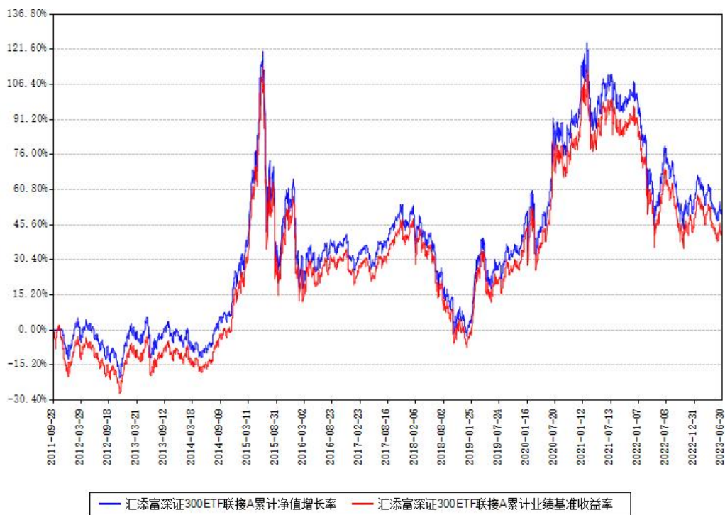
汇添富深证300ETF联接A累计净值增长率与同期业绩基准收益率对比图

(二) 自基金合同生效以来基金累计净值增长率变动及其与同期业绩比较基准收益率变动的比较图