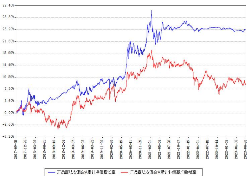
汇添富弘安混合A累计净值增长率与同期业绩基准收益率对比图

(二) 自基金合同生效以来基金累计净值增长率变动及其与同期业绩比较基准收益率变动的比较图