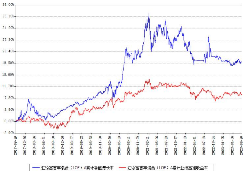
汇添富睿丰混合（LOF）A累计净值增长率与同期业绩基准收益率对比图

(二) 自基金合同生效以来基金累计净值增长率变动及其与同期业绩比较基准收益率变动的比较图