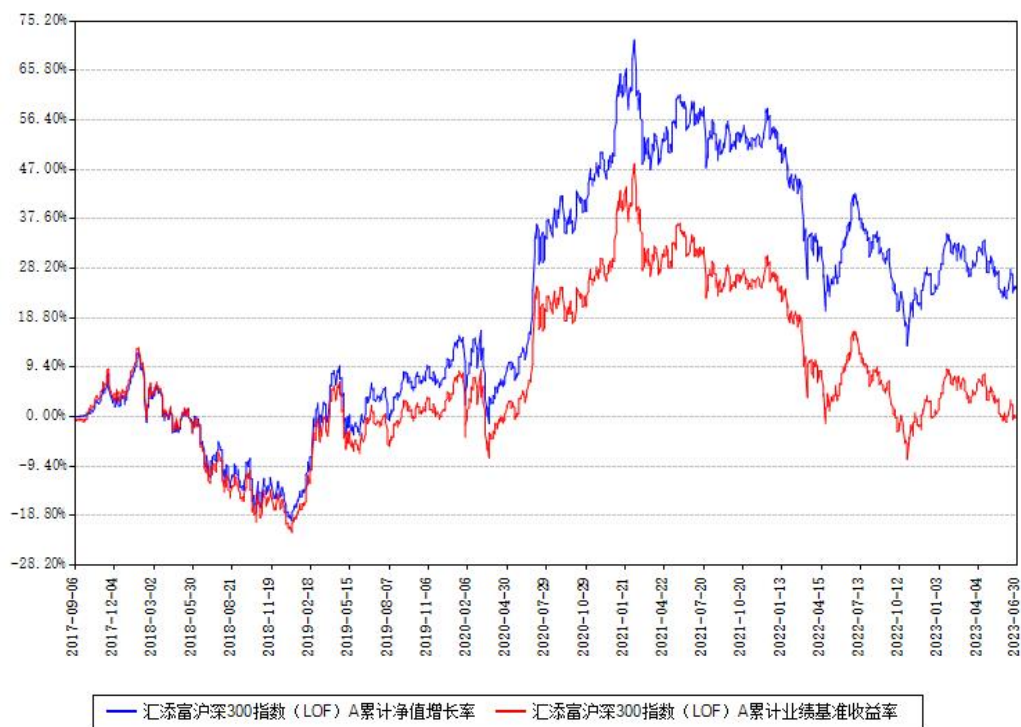
汇添富沪深300指数 (LOF) A 累计净值增长率与同期业绩基准收益率对比图