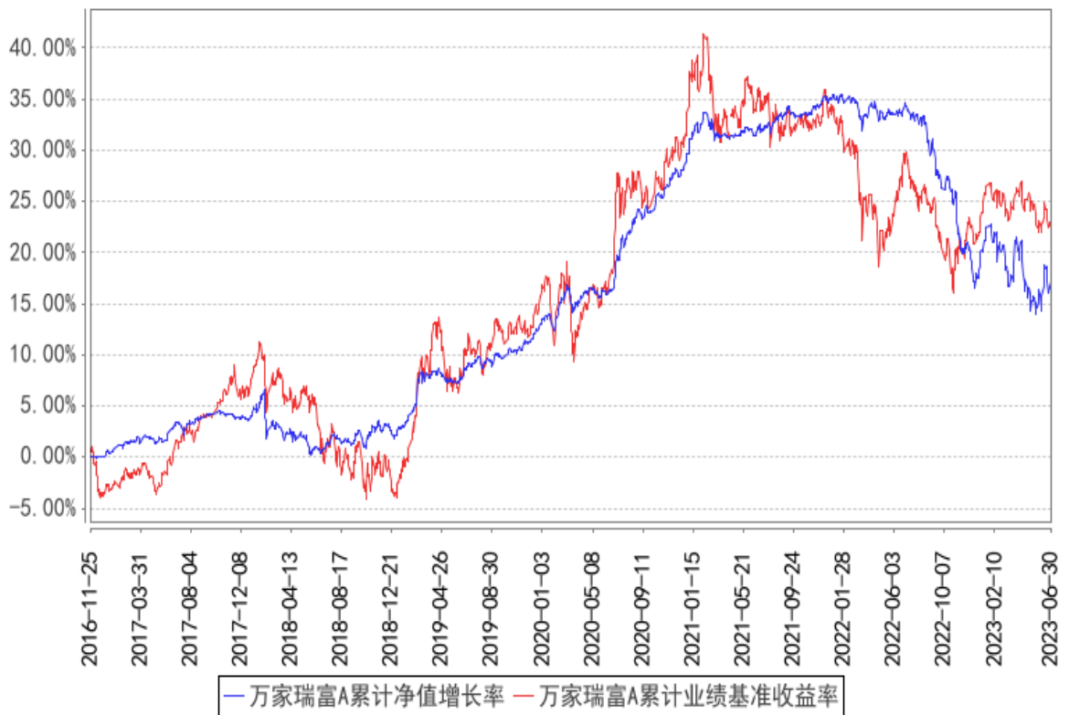
万家瑞富A累计净值增长率与同期业绩比较基准收益率的历史走势对比图

(二) 自基金合同生效以来基金累计净值增长率变动及其与同期业绩比较基准收益率变动的比较