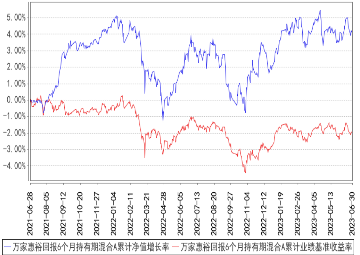
万家惠裕回报6个月持有期混合A累计净值增长率与同期业绩比较基准收益率的历史走势对比图

(二) 自基金合同生效以来基金累计净值增长率变动及其与同期业绩比较基准收益率变动的比较