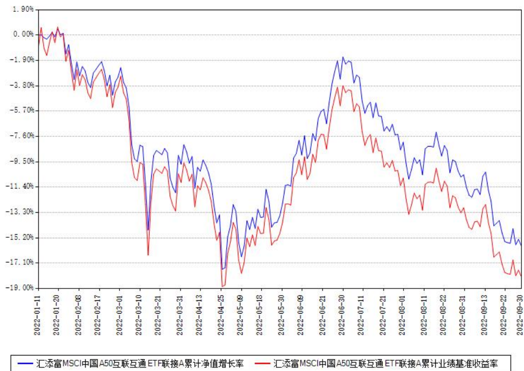
汇添富MSCI中国A50互联互通ETF联接A累计净值增长率与同期业绩基准收益率对比图