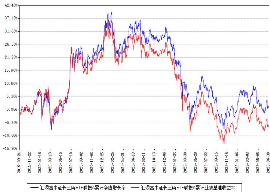
汇添富中证长三角ETF联接A累计净值增长率与同期业绩基准收益率对比图