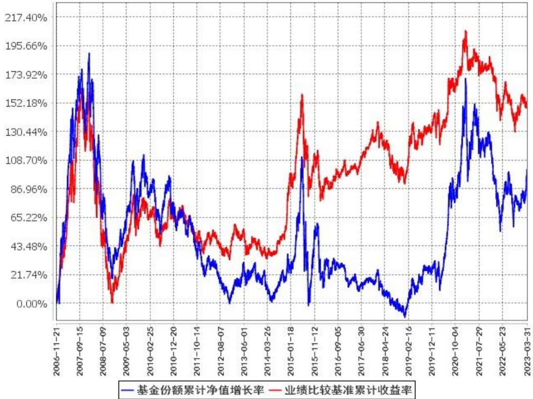
基金份额累计净值增长率与同期业绩比较基准收益率的历史走势对比图 (2006年11月21日至2023年3月31日)

注：1、根据本基金的基金合同第十一部分“基金投资”中“八、投资组合限制”的规定，本基金自2006年11月21日合同生效之日起六个月内为建仓期，建仓期结束时各项资产配置比例符合基金合同约定。