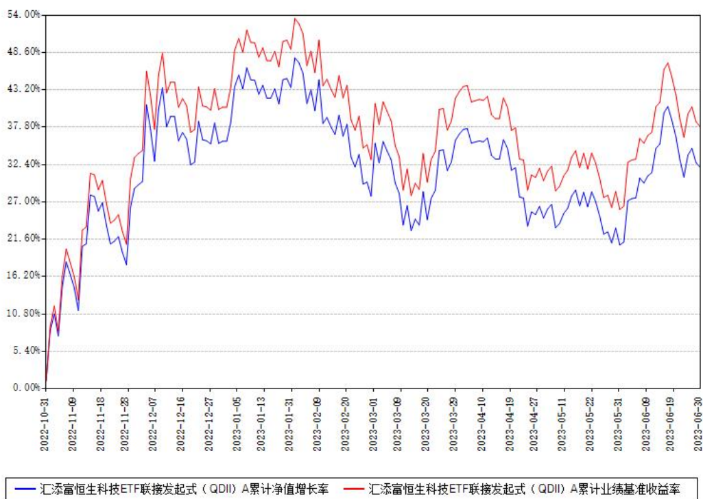
汇添富恒生科技ETF联接发起式（QDII）A累计净值增长率与同期业绩基准收益率对比图

(二) 自基金合同生效以来基金累计净值增长率变动及其与同期业绩比较基准收益率变动的比较图