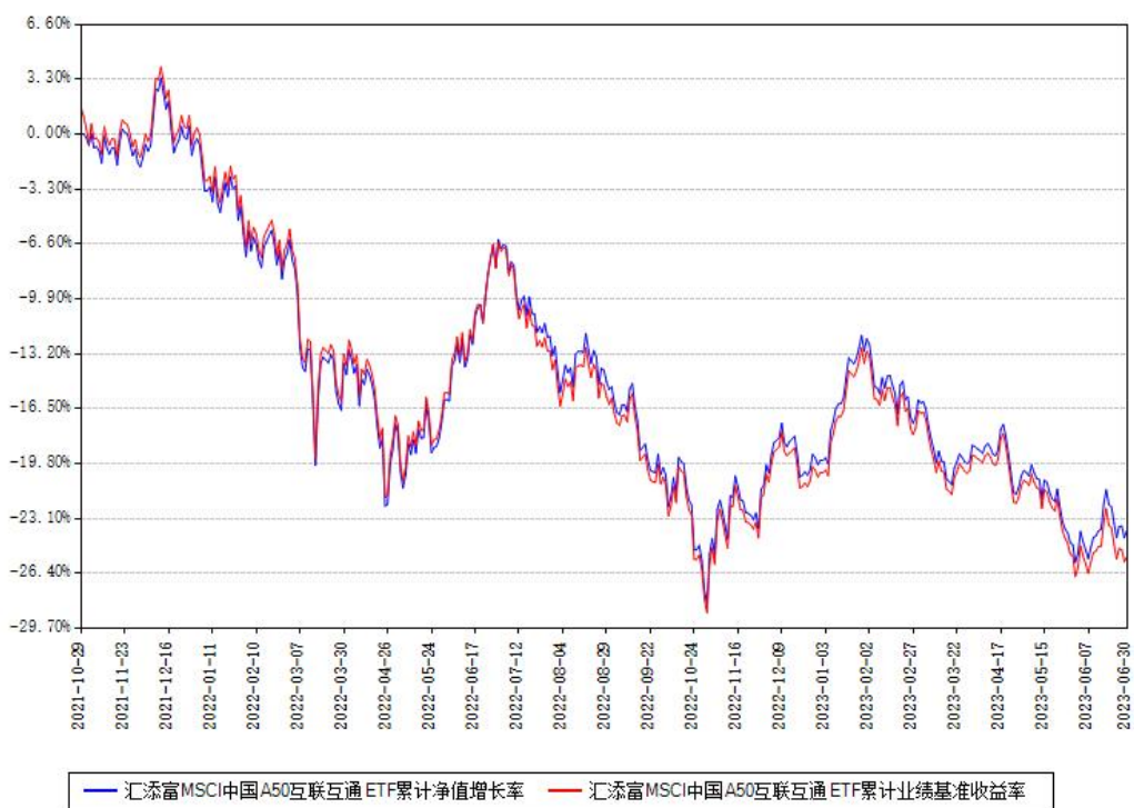
汇添富MSCI中国A50互联互通ETF累计净值增长率与同期业绩基准收益率对比图