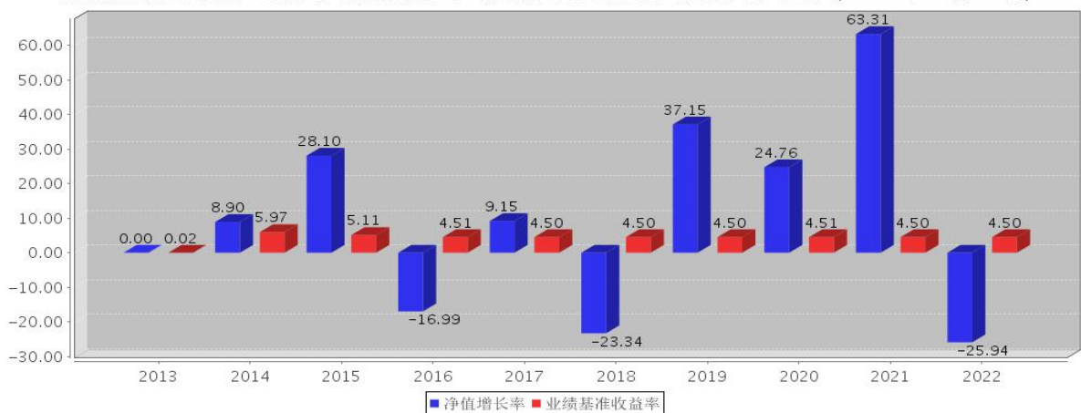
安信鑫发优选混合A基金每年净值增长率与同期业绩比较基准收益率的对比图(2022年12月31日)

注:基金合同生效当年期间的相关数据按实际存续期计算。基金的过往业绩并不代表其未来表现。