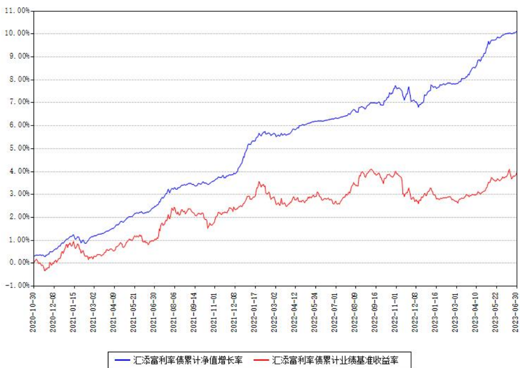
汇添富利率债累计净值增长率与同期业绩基准收益率对比图