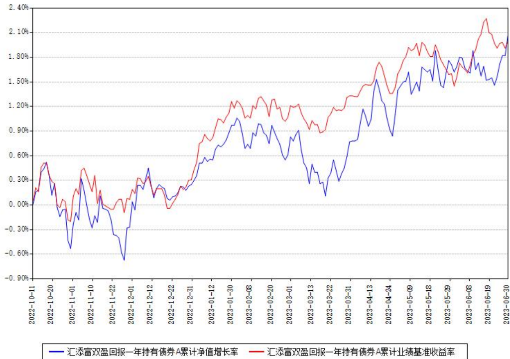
汇添富双盈回报一年持有债券C累计净值增长率与同期业绩基准收益率对比图