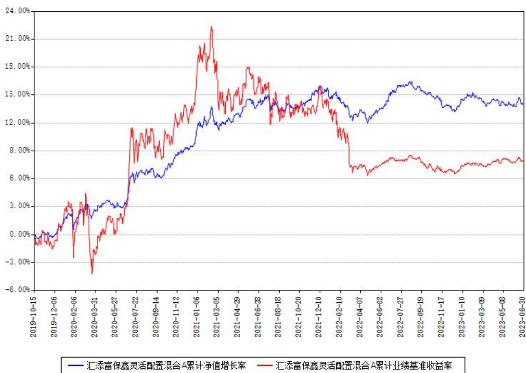
汇添富保鑫灵活配置混合A累计净值增长率与同期业绩基准收益率对比图