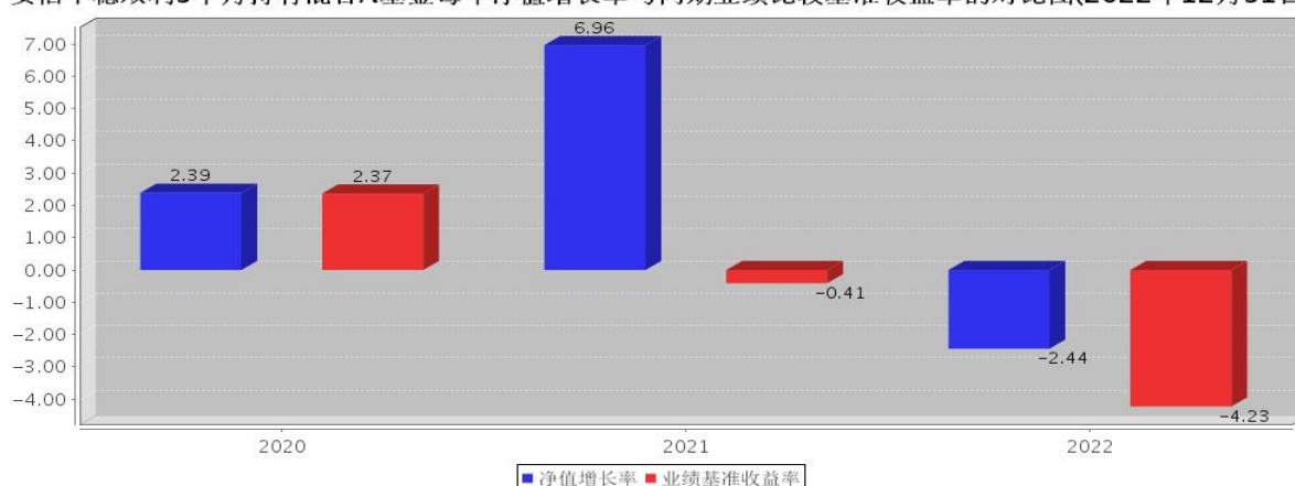
安信平稳双利3个月持有混合A基金每年净值增长率与同期业绩比较基准收益率的对比图(2022年12月31日)

注:基金合同生效当年期间的相关数据按实际存续期计算。基金的过往业绩并不代表其未来表现。