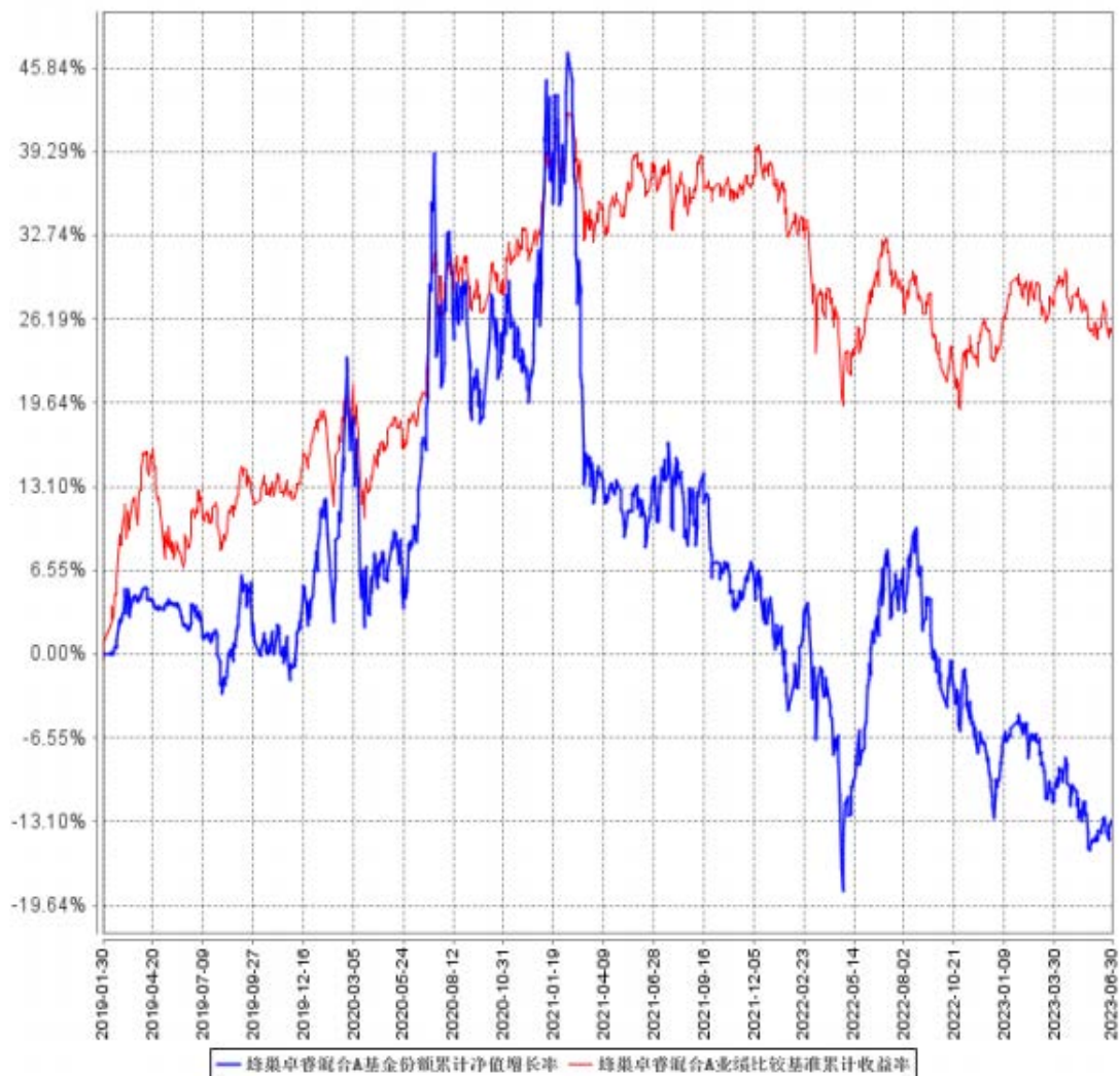
蜂巢卓睿混合A基金份额累计净值增长率与同期业绩比较基准收益率的历史走势对比图