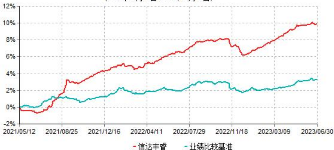
信达丰睿六个月持有期债券型集合资产管理计划累计净值增长率与业绩比较基准收益率历史走势对比图 (2021年05月12日-2023年06月30日)