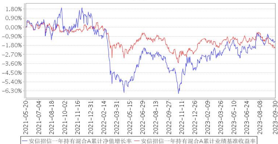
安信招信一年持有混合A累计净值增长率与同期业绩比较基准收益率的历史走势对比图