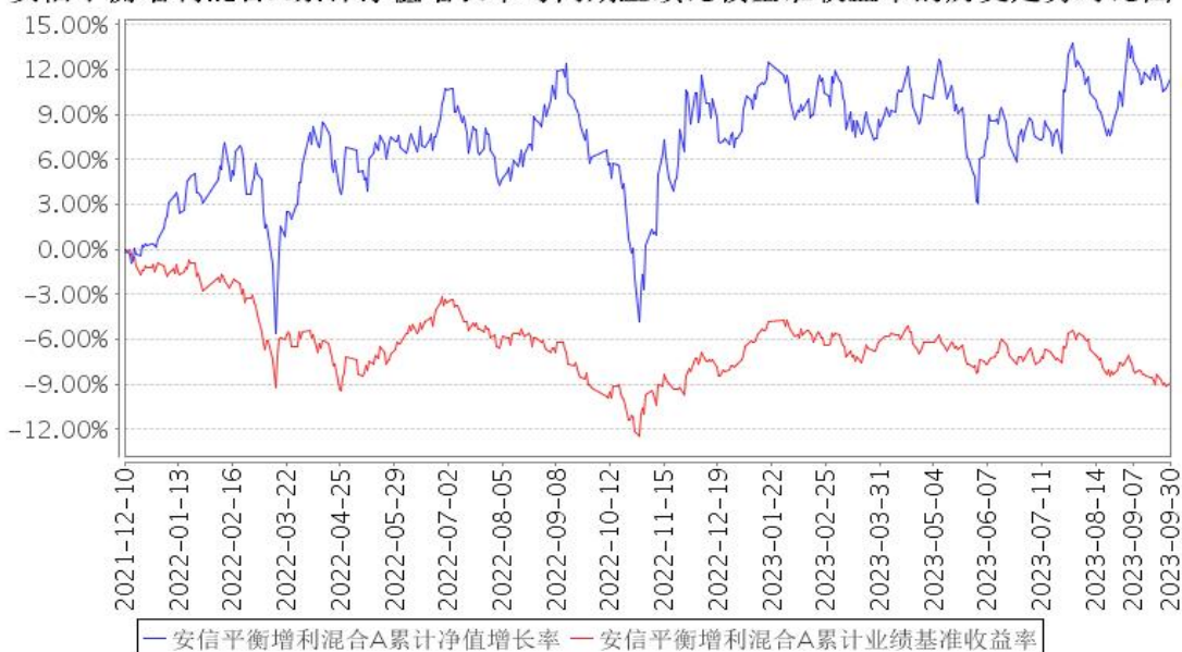
安信平衡增利混合A累计净值增长率与同期业绩比较基准收益率的历史走势对比图