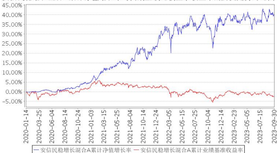
安信民稳增长混合A累计净值增长率与同期业绩比较基准收益率的历史走势对比图