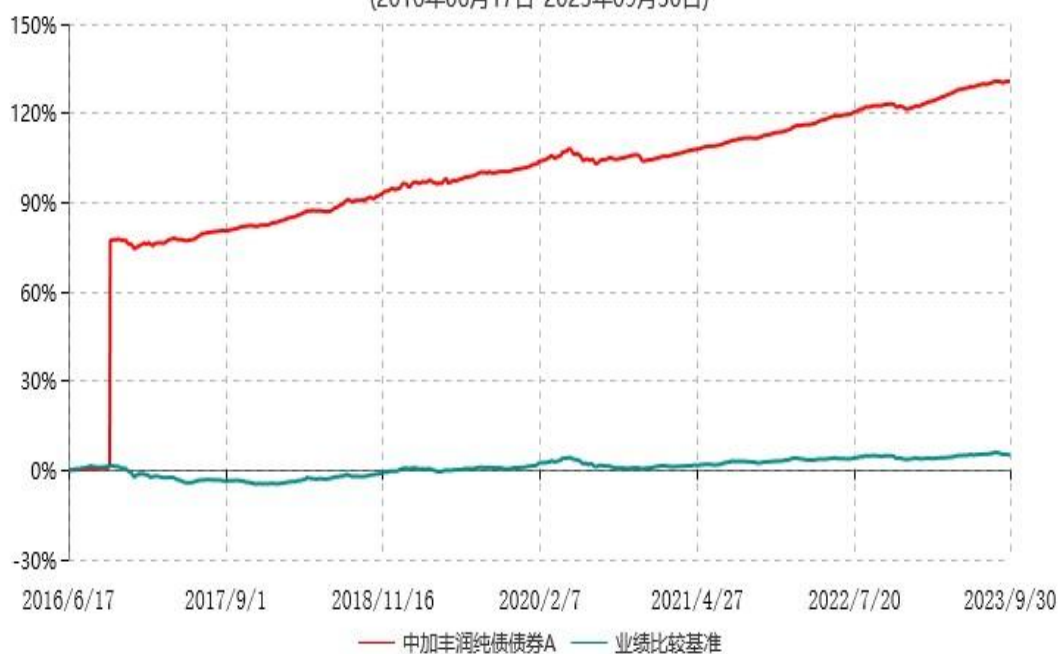
中加丰润纯债债券A累计净值增长率与业绩比较基准收益率历史走势对比图 (2016年06月17日-2023年09月30日)