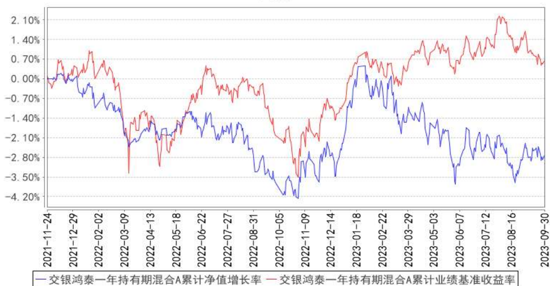
交银鸿泰一年持有期混合A累计净值增长率与同期业绩比较基准收益率的历史走势对比图