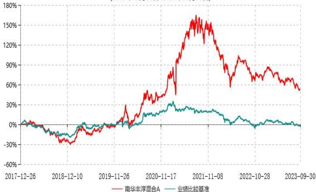
南华丰淳混合C累计净值增长率与业绩比较基准收益率历史走势对比图