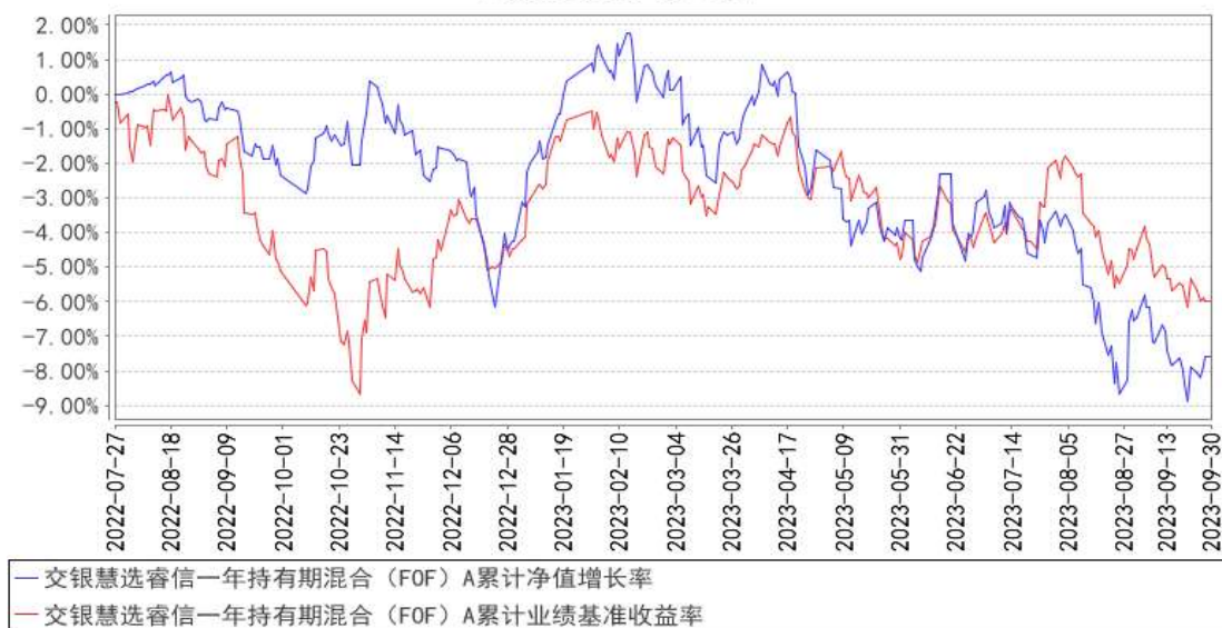
交银慧选睿信一年持有期混合（FOF）A 累计净值增长率与同期业绩比较基准收益率的历史走势对比图