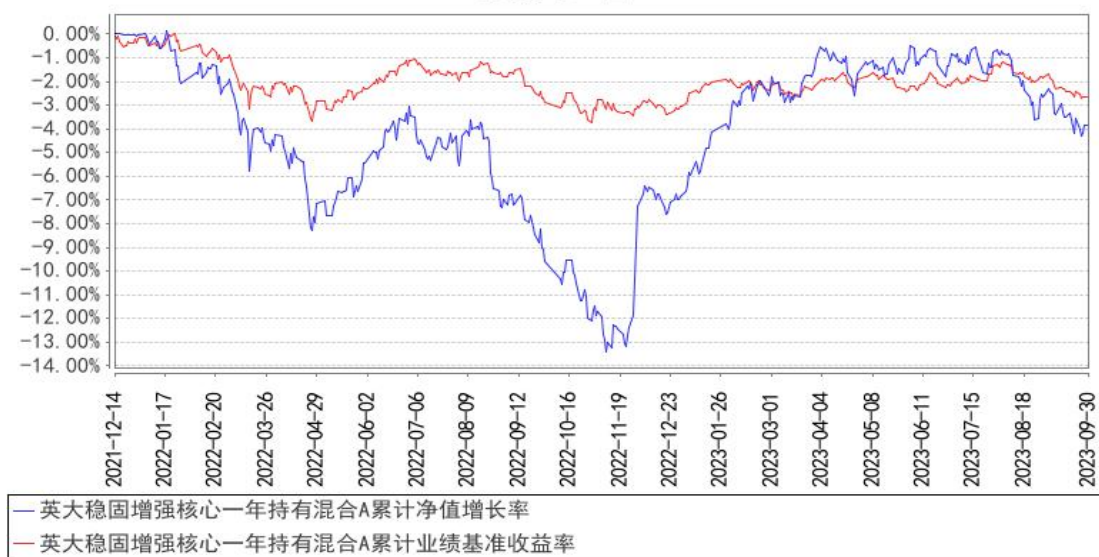
英大稳固增强核心一年持有混合A累计净值增长率与同期业绩比较基准收益率的历史走势对比图