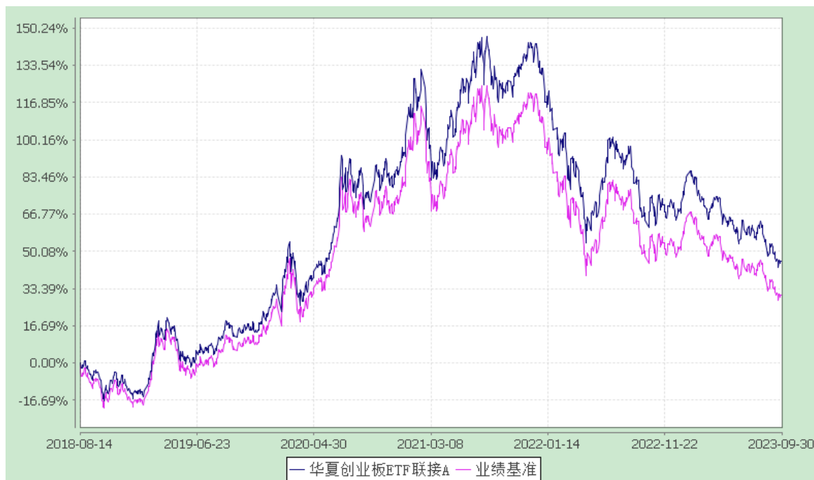
华夏创业板 ETF 联接 C: