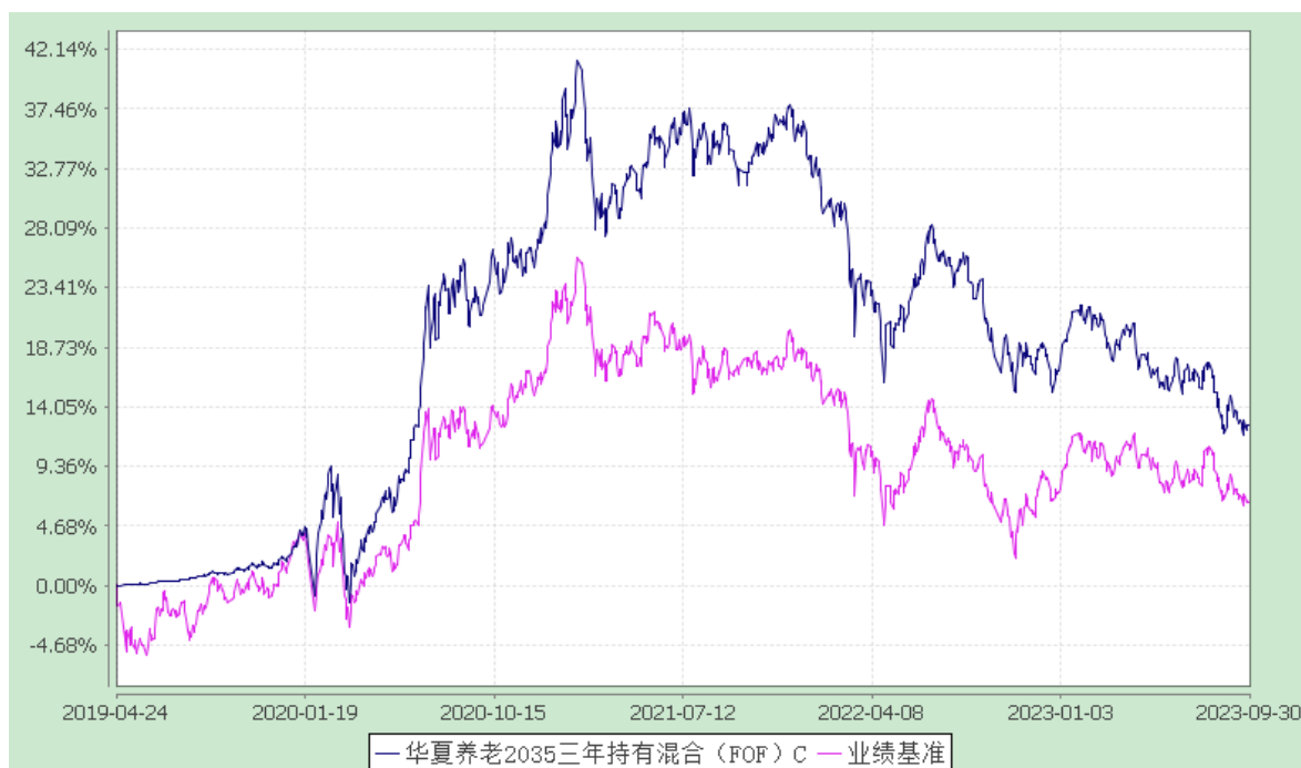
华夏养老 2035 三年持有混合（FOF）Y：