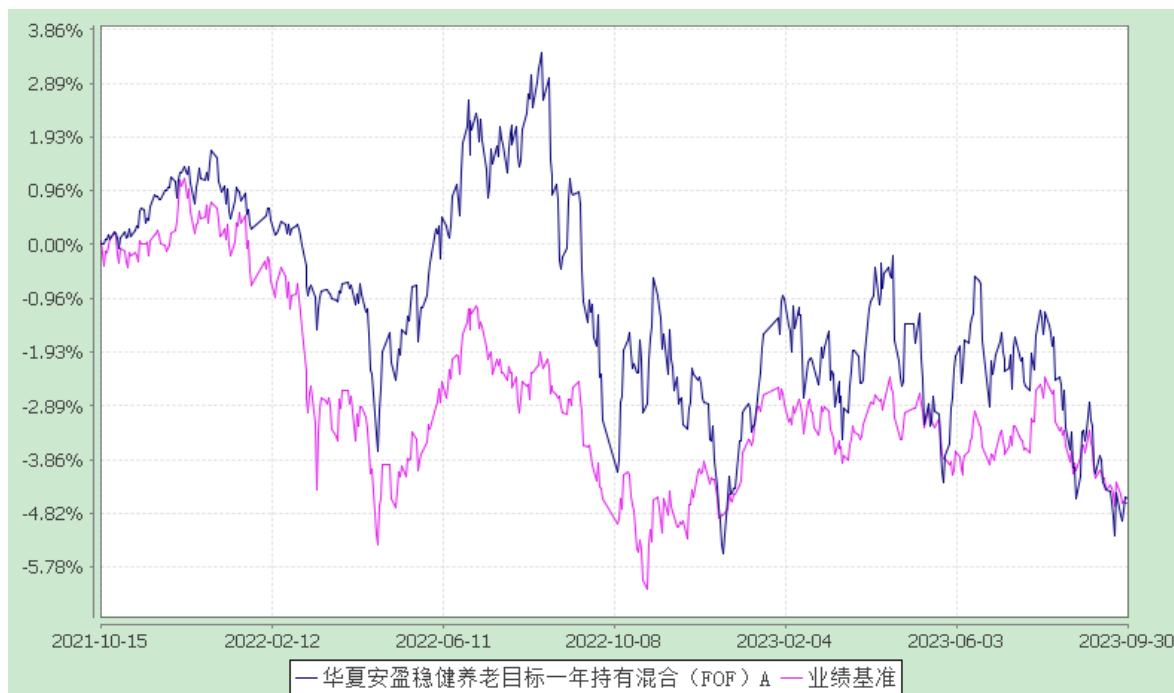
华夏安盈稳健养老目标一年持有混合（FOF）Y：