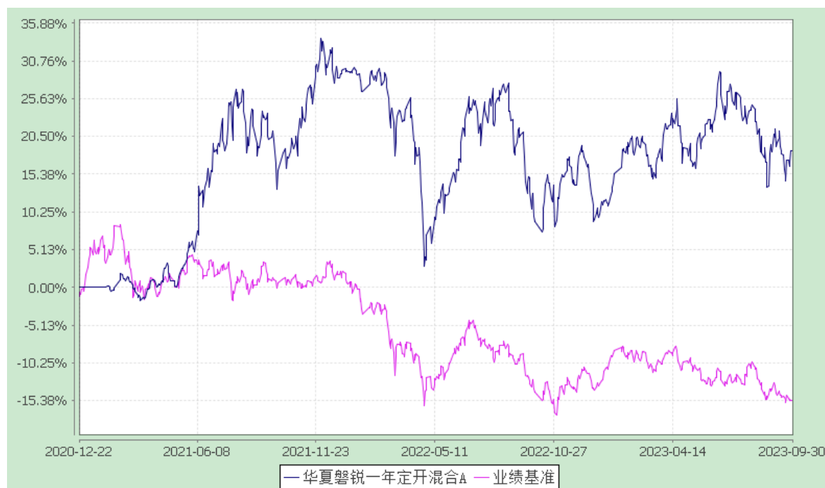
华夏磐锐一年定开混合 C: