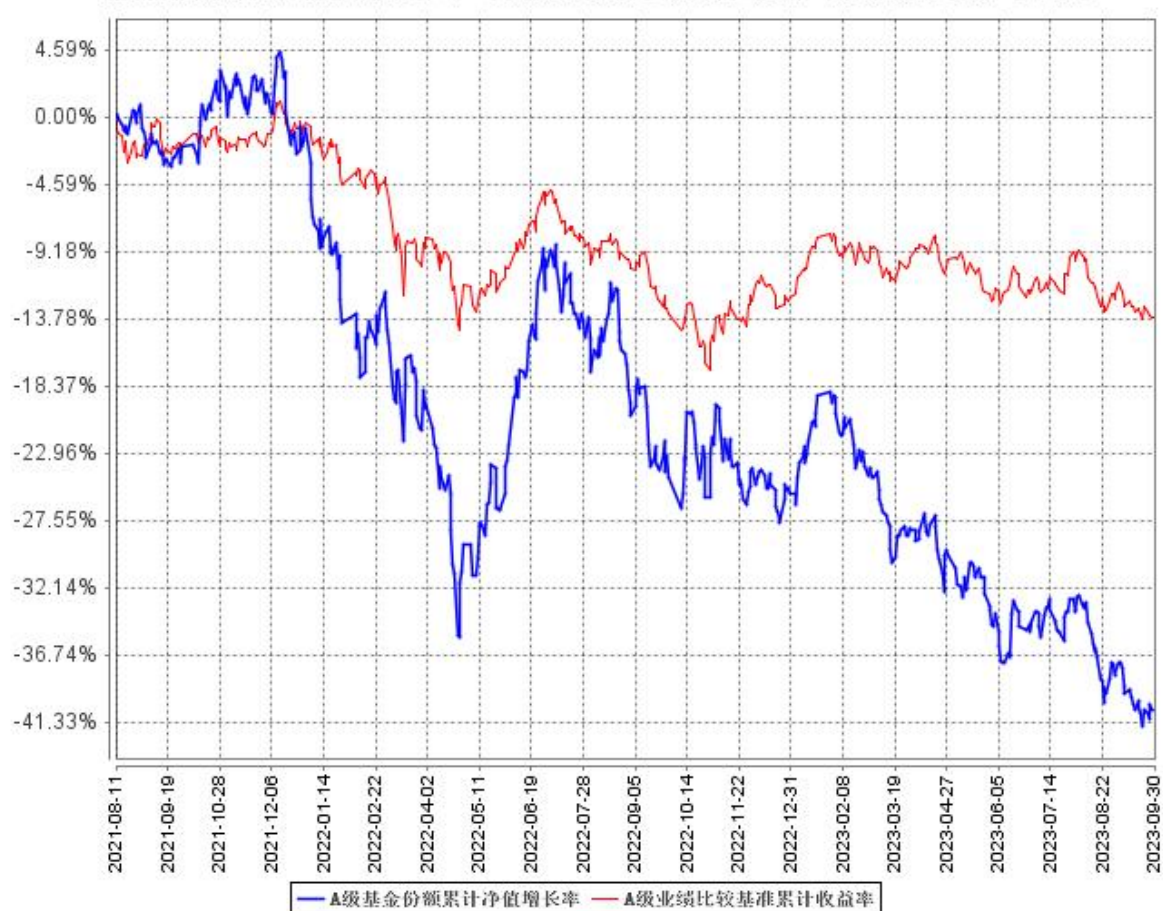
A 级基金份额累计净值增长率与同期业绩比较基准收益率的历史走势对比图