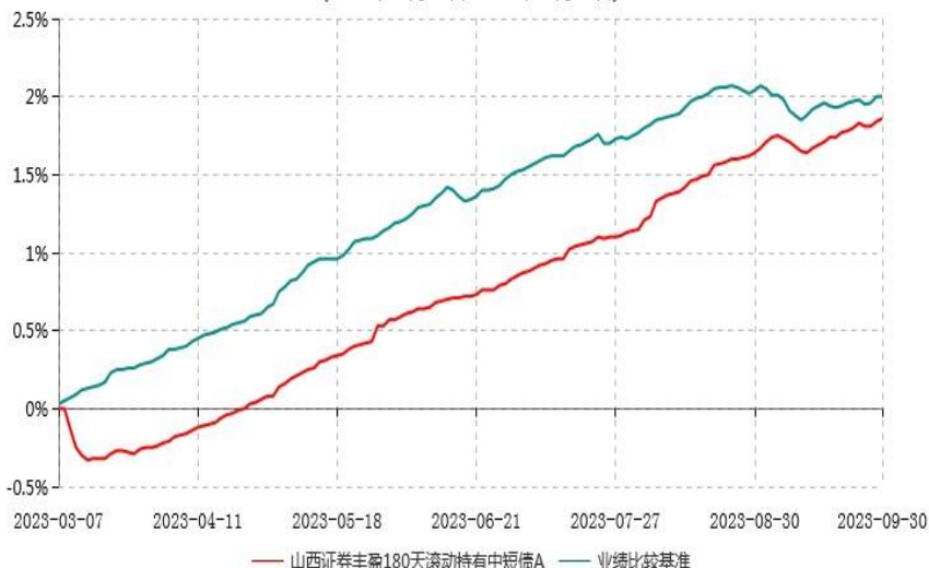
山西证券丰盈180天滚动持有中短债C累计净值增长率与业绩比较基准收益率历史走势对比图