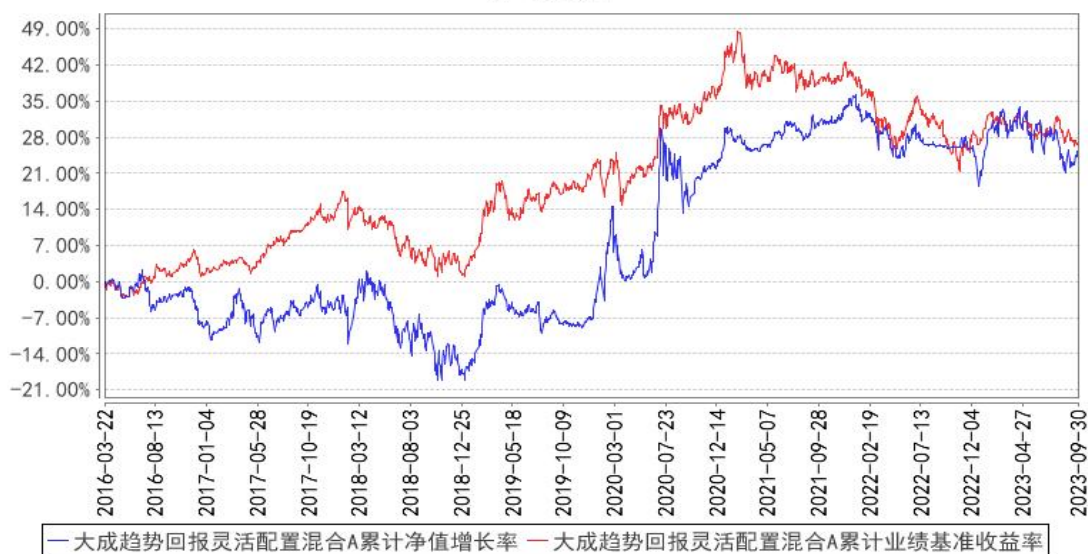
大成趋势回报灵活配置混合A累计净值增长率与同期业绩比较基准收益率的历史走势对比图